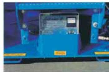
Trukkinosto mahdollisuus myös päädyssä