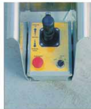
Yksinkertainen yhdenkäden joystick