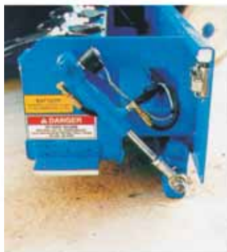
Hydraulitoimiset automaattiset kaatumis-suojat