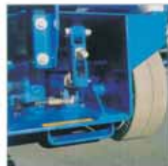
Likaamattomat renkaat 200 mm sisäkääntösäde